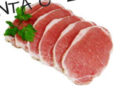
CINTA O LIBROS